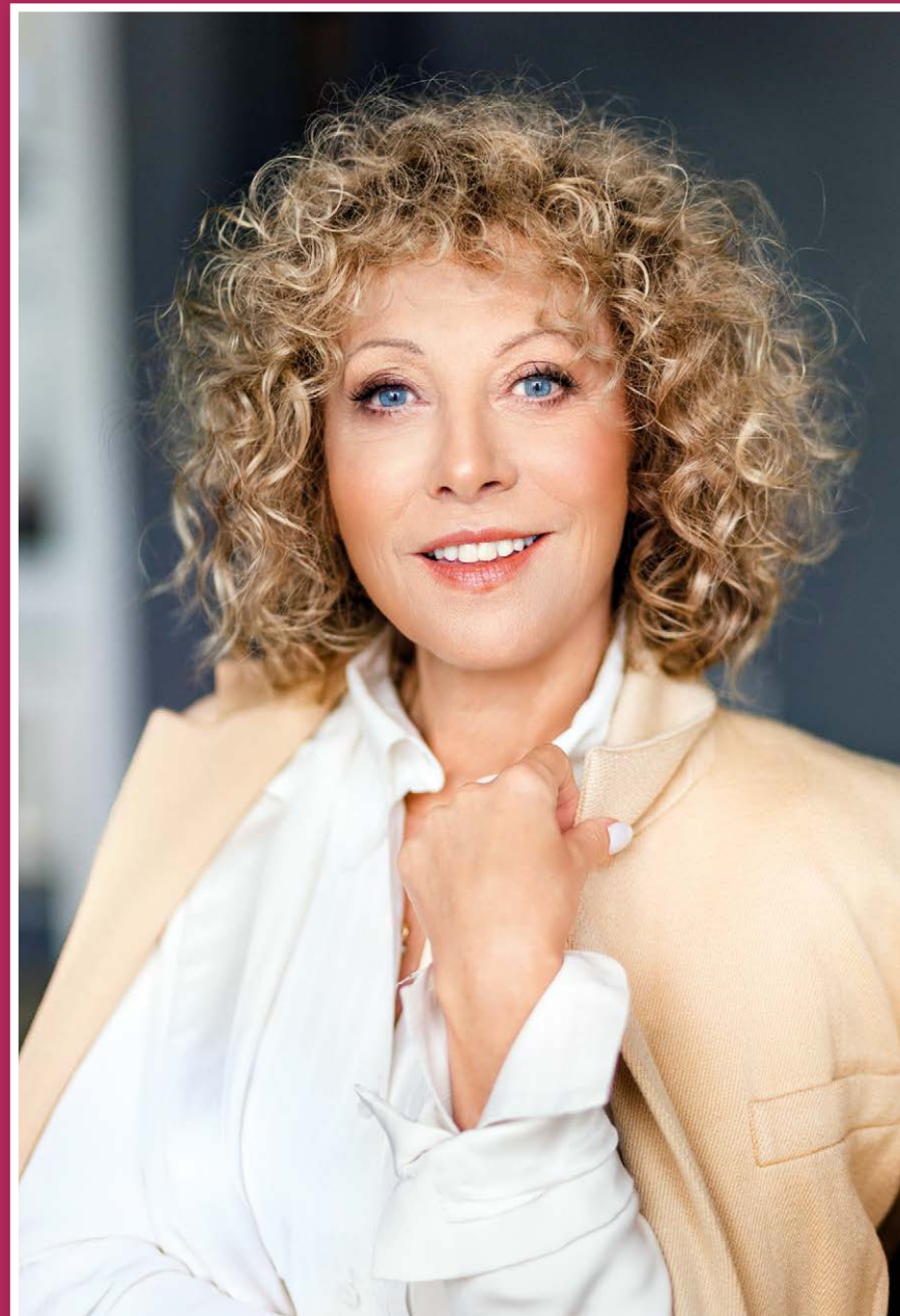
Alicja Majewska wystąpi na Scenie MCER z repertuarem z najnowszej płyty „Piosenki Korcza i Andrusa”.

Jednym z najważniejszych wydarzeń będzie koncert Alicji Majewskiej