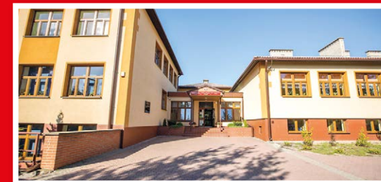
Zespół Szkół nr 2 ul. Wczasowa 5