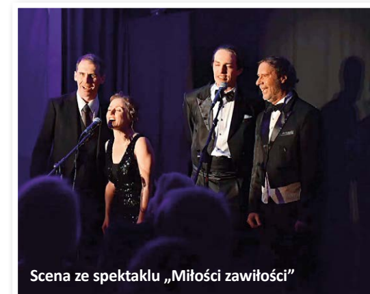
Scena ze spektaklu „Miłości zawiłości”

Więcej szczegółów oraz regulamin na naszej stronie www.mokmarki.pl