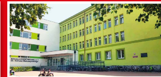
Szkoła Podstawowa nr 1, ul. Okólna 14