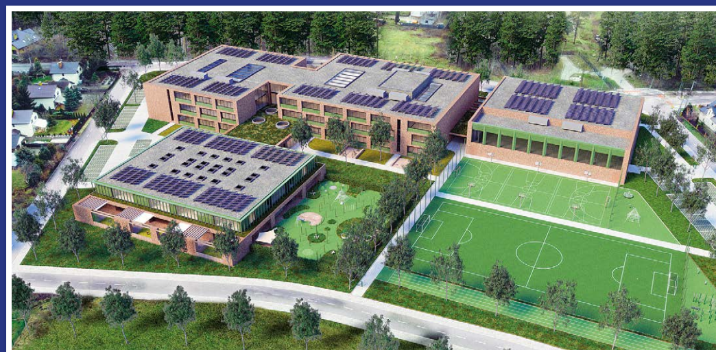
Żłobek, szkoła, boiska – tak ma wyglądać obiekt przy Żeromskiego.