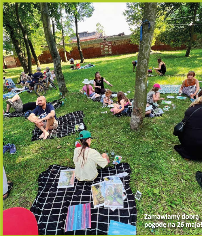
Zamawiamy dobrą pogodę na 26 maja!

4. Wystawa plenerowa Zaprezentujemy prace, które powstaną podczas zajęć z malarstwa i rysunku. Oczywiście tematyka wystawy związana będzie z Mamami!