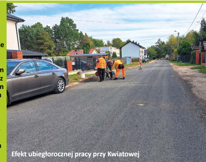
Efekt ubiegłorocznej pracy przy Kwiatowej