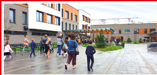
Szkoła Podstawowa nr 4 ul. Wspólna 40