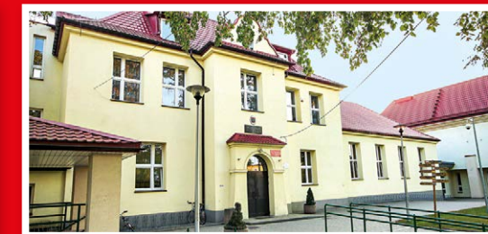
Szkoła Podstawowa nr 3 ul. Pomnikowa 21