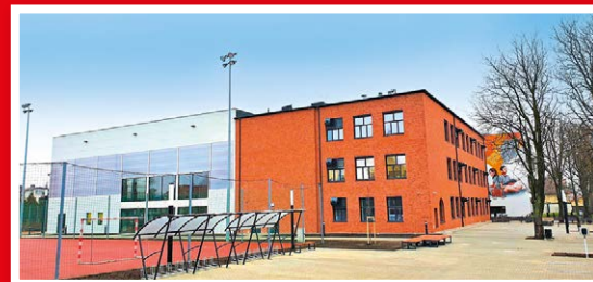
Szkoła Podstawowa nr 2 ul. Szkolna 9