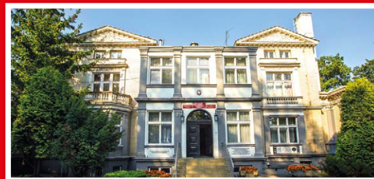
Zespół Szkół nr 1 ul. Aleja Marszałka Józefa Piłsudskiego 96